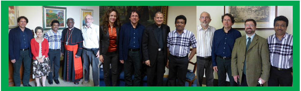
Reunión con el Consejo Pontificio Justicia y Paz